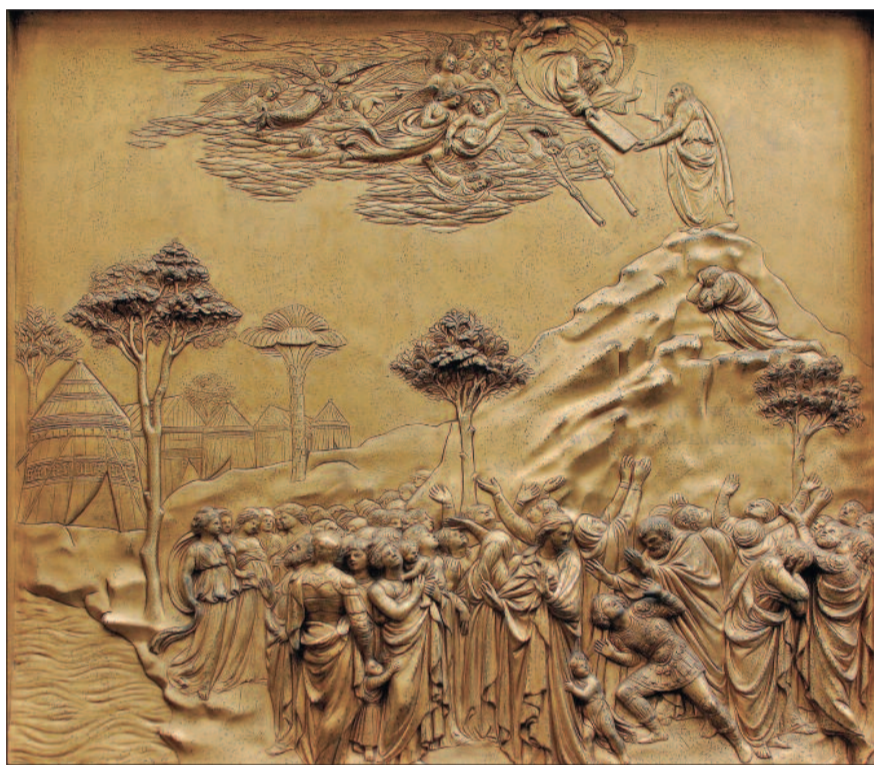
Mózes a Sínai-hegyen átveszi a törvénytáblákat

– Mózes hosszú életútjának alapvetően négy nagy eseményét emeli ki az ószövetségi hagyomány. Az első a csipkebokorélménye a pusztában, amikor elhívását kapta Istentől (2Móz 3). A második nagy esemény az Egyiptomból való kivonulás (2Móz 14), amikor száraz lábbal vezetett át népét a Vörös-tengeren, eredeti nevén Nádas-tengeren. A harmadik nagy jelentőségű