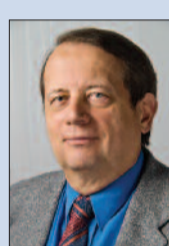
Evangelikus istentisztelet a Duna Televízióban

A sokrétű szolgálat hűen tükrözi vissza a szarvasi gyülekezet sokszínűségét, amelyben meghatározó az örökség ápolása, de a helyi közösség a hétköznapiakban mindig keresi a nyitás lehetőségét is a körülötte élők felé.