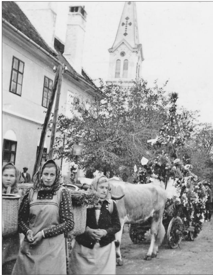
Szüreti felvonulás 1936-ban (háttérben a parókia és a templom) ▲