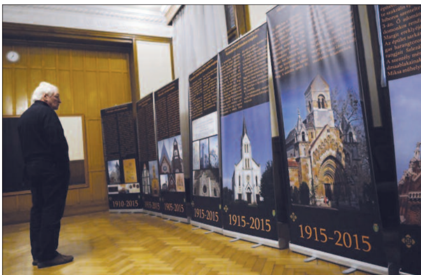
Részlet a 100 éves templomok a Kárpát-medencében című kiállításról