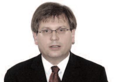
Fabiny Tamás püspök Északi Egyházkerület

Az már egy másik történet, hogy amikor fiam két évtized múlva faszori osztálytalálkozóra megy, akkor dűdölje-e majd Cseh Tamásék dalát. És idézi-e valaki nekik a Prédikátor könyvét.