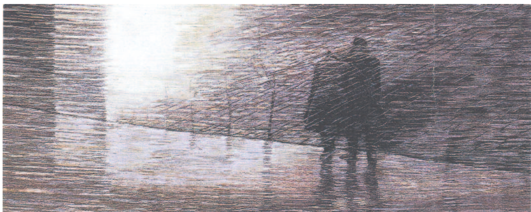
SZABADSÁG – 1999