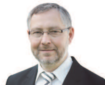
Szemerei János püspök Nyugati (Dunántúli) Egyházkerület

A Lélek szelében óriási erő van! Ó, jöjj, teremtő Szentlélek, látogasd meg a te néped!