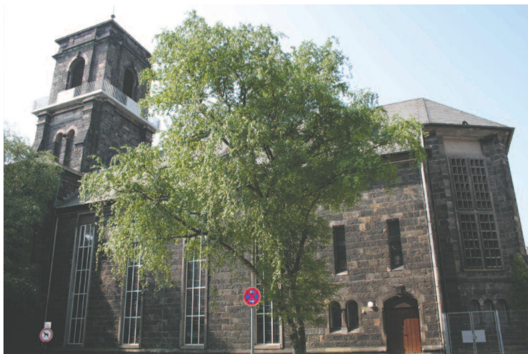
A wuppertal-barmeni gyülekezet temploma